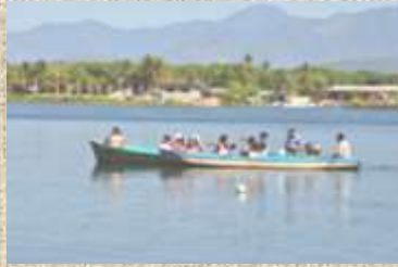
Boca del Cielo, Chiapas