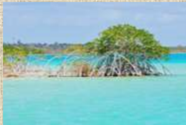
Laguna Bacalar, Quintana Roo

Síntesis: Analizar y comparar las dinámicas de conflictos y cooperación en diez cuencas transfronterizas centroamericanas y del sur de México con la finalidad de crear un grupo de colaboración académica entre México y los siete países de Centro América y replantear teóricamente la relación entre conflictos y cooperación.