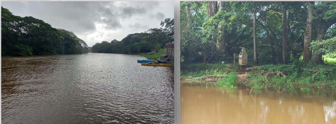
El Río Frío y mojón que indica el límite geopolítico entre Costa Rica y Nicaragua

Caminar por la mañana permite contemplar la belleza del lugar, al tiempo que sentir el calor del trópico y la humedad característica de la época de lluvias. Los Chiles es resguardado por el imponente Río Frío, que inicia en Costa Rica y desemboca en Nicaragua, recordándonos que la naturaleza no tiene fronteras, que éstas han sido impuestas por la humanidad.