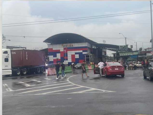
Foto: Frontera Paso Canoas, Costa Rica-Panamá. Agosto 2023