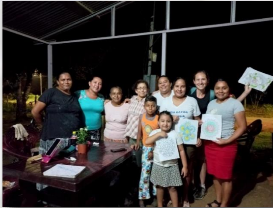
Mujeres nicaragüenses viviendo en El Achiotal, Barrio de Los Chiles.

Orgullosas de lo que han logrado, relatan sus historias. La añoranza por Nicaragua se respira cuando narran las comidas, las fiestas, las ropas de su tierra. Agradecidas con Costa Rica porque sus hijos ya han nacido en esta tierra; angustiadas por la familia que se quedó “allá” y no ha logrado salir. La alegría de estas mujeres las hace fuertes, están convencidas que sólo haciendo equipo pueden salir adelante. La esperanza de que el “emprendimiento” prospere las mantiene firmes. La lucha por algún día conseguir “papeles” que las acrediten como propietarias de sus tierras es algo con lo que han aprendido a vivir.