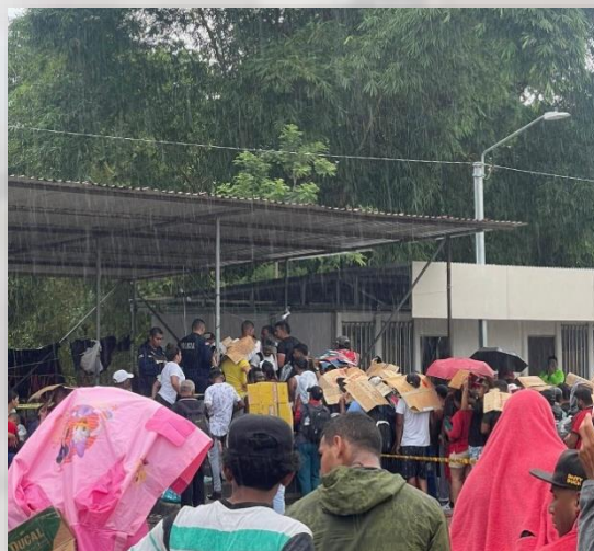
Foto: Bajo la lluvia. Largas filas para comprar un ticket de autobús en el Campamento ferial. Paso Canoas, agosto 2023

Ante esta lamentable realidad, en Paso Canoas, se ha instalado un campamento ferial entre marzo y abril de 2023, que funge como un espacio de espera para los miles de personas que no logran continuar y no tienen los recursos para pagar una habitación de hotel, en este espacio convergen poblaciones provenientes mayoritariamente de Venezuela y Colombia. Aunado a la presencia de haitianos que es notoria, en las largas filas para comprar un boleto de pasaje, toda vez, que en el campamento se ha instalado una taquilla y a la vez sirve de estacionamiento pues de allí parten los autobuses para el cantón de Los Chiles. Con información recabada por las colegas Carmen Fernández y Yaalsti Guevara, se tiene que aproximadamente los autobuses Tracopa transportan diariamente a 1500 personas.