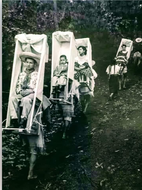
Foto 2. Ladinis de una de las fincas del Soconusco.