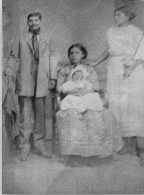
Foto 1. Familia de Ladinos del pueblo Montaña Blanca