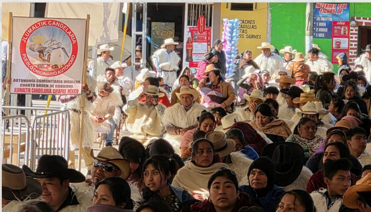
Foto: Jlumaltik Candelaria

El 26 de febrero del 2026, la Primera Sala de la Suprema Corte de Justicia de la Nación (SCJN) realizó su Primera Sesión Extraordinaria en Territorio en la plaza pública de la cabecera municipal de Tenejapa, Chiapas. La prensa y medios de comunicación nombraron este hecho como histórico por varias razones. En primer lugar, es la primera ocasión en que los ministros de esta corte sesionaron fuera de su recinto desde 1917; ya no se trataba de un exilio sino de acercar el tratamiento de la justicia a los pueblos. En segundo lugar, en esta sesión se trataron temas vinculados a los derechos indígenas; uno de los más importantes fue el reconocimiento del derecho a la libre determinación, autogobierno y presupuesto directo de Jlumaltik Candelaria, una comunidad agraria maya tsotsil del municipio de San Cristóbal de Las Casas.